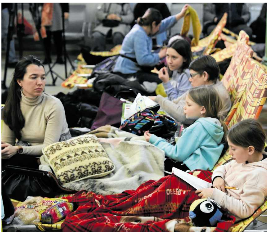
• Жінки та діти, які екстрено прибули до Польщі, не знають що їх чекає далі. Але сьогодні вони в безпеці - і це найважливіше.