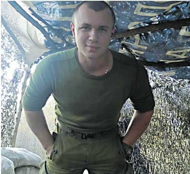
• Він просто прагнув справедливості.