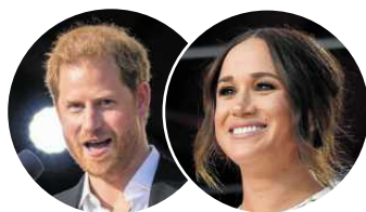
ПРИНЦ ГАРРІ ТА МЕГАН МАРКЛ:

“Україно. Світ слідкує за тобою. Мої думки з усіма прекрасними людьми, яких я зустріла у Києві. Сподіваюся, ви у безпеці”.