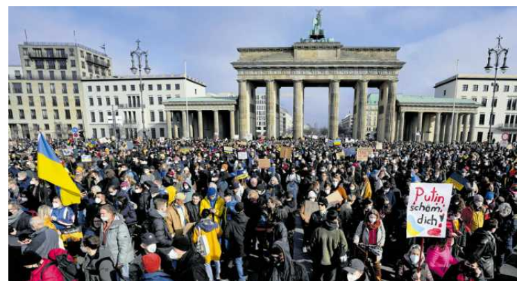
• Сьогодні гасло “Слава Україні!” звучить на усіх континентах.

Також ми виходимо на мітинги. Коли у соцмережах побачила допис про акцію у Вроцлаві, навіть не задумувалась, іти чи ні. Адже я солідарна з Україною. У мене багато друзів там, і я щоденно чекаю від них звістку про те, що живі.