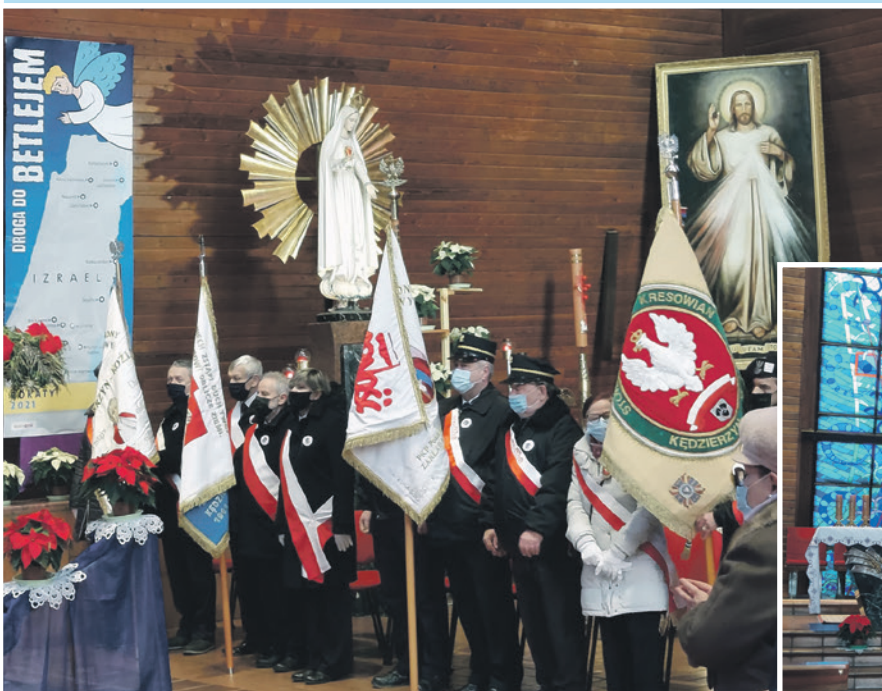
- KĘDZIERZYN-KOŹLE -