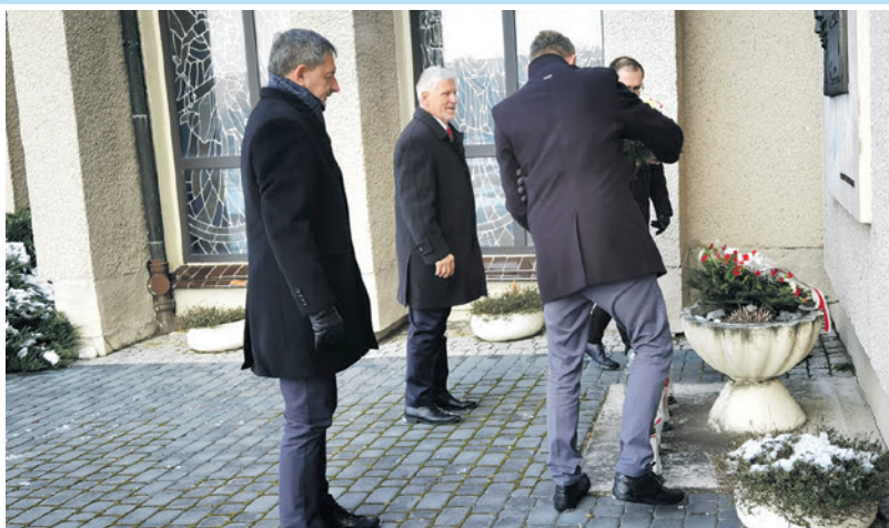
- KLUCZBORK -