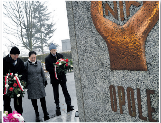
- OPOLE -