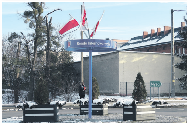
- GRODKÓW -