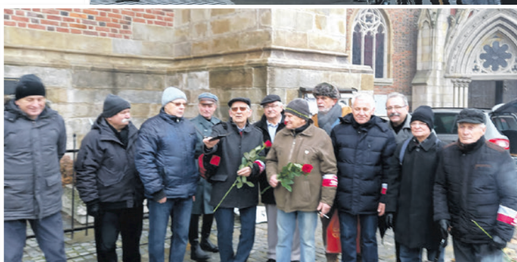
- NYSA -