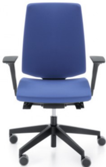
LU mechanizm synchroniczny z regulacją głębokości siedziska