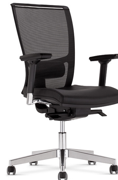
ZB mechanizm synchroniczny z regulacją wysokości oparcia

DOSTĘPNA KOLORYSTYKA TAPICERKI MATERIAŁOWEJ: