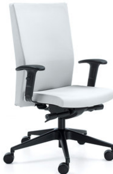
PL mechanizm synchroniczny z regulacją głębokości siedziska