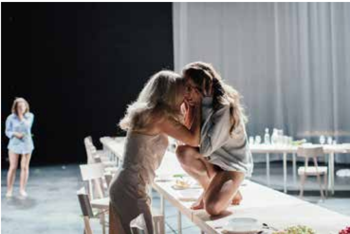
„Uroczystość” Teatr Jana Kochanowskiego w Opolu