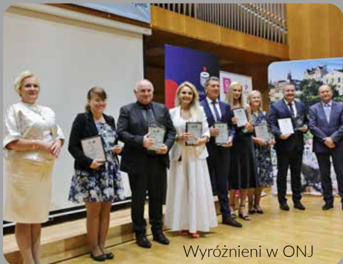
Wyróżnieni w ONJ