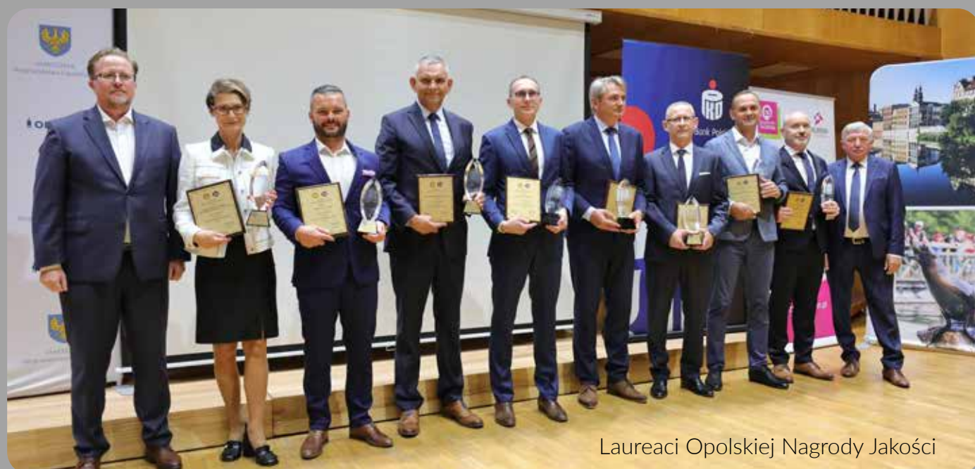
Laureaci Opolskiej Nagrody Jakości