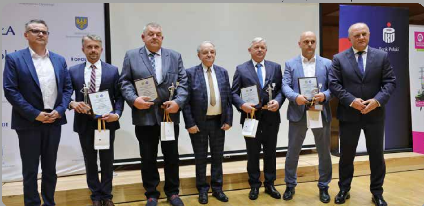
Finałiści XIV Konkursu Znakomity Przywódca