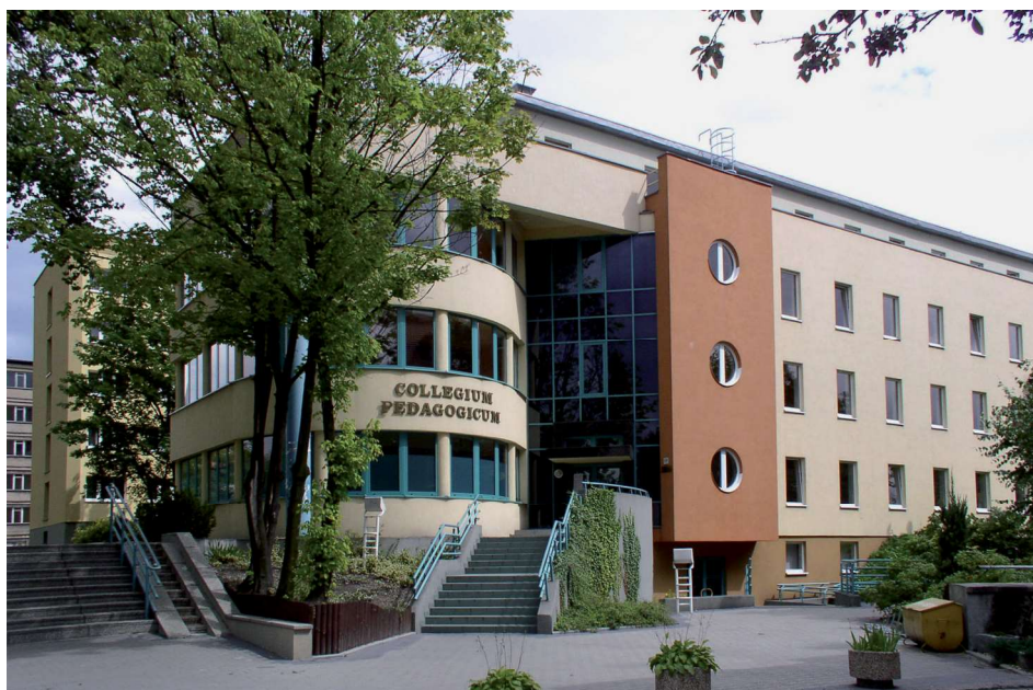
Siedziba Instytutu Studiów Edukacyjnych