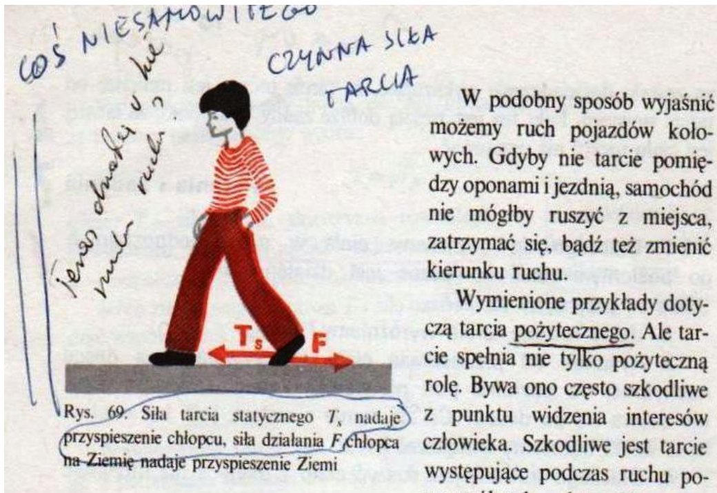
Rys.1. Mazanie po książce G.B. i W.D.

Tylny but, który zdrowymi mięśniami poruszany, powinien teraz być unoszony nad podłogą ukosem w górę jest wg H.B. popychany siłą tarcia T poziomo po podłodze aby przyspieszyć całego chłopca w lewo.