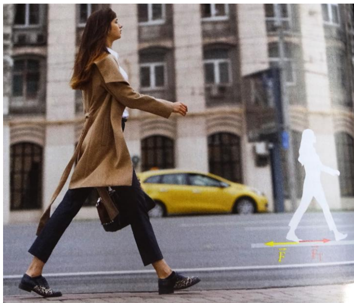
Rys. 4 Autorzy F-O, K., N-R

Klasa 7 Spotkania z Fizyką „Nowa Era” s. 70 proszę zwrócić uwagę na bladą sylwetkę „ducha” i dopatrzyć się czerwonej strzały u tylnej zelówki.